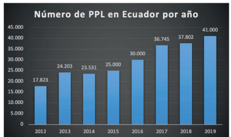
Tabla 2. Número de PPL por año en comparación. Elaboración propia.

De los 41.000 PPL el 29% está privado de su libertad por delitos de drogas y el 26% por delitos en contra de la propiedad. El porcentaje de los delitos sexuales representa 15%, los delitos de asociación ilícita y delincuencia organizada corresponden al 5% y otros delitos, 12% 5 . De los 41.000, el 36% no tienen sentencia ejecutoriada 6 .